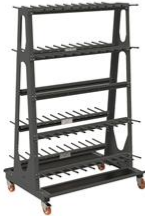
CARR 250-120/22 Q