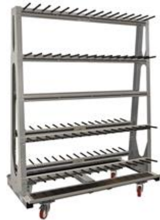
CARR 250-100/30 Q